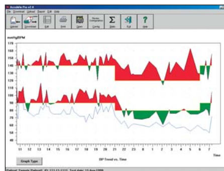
Estadísticas de interpretación del AccuWin Pro